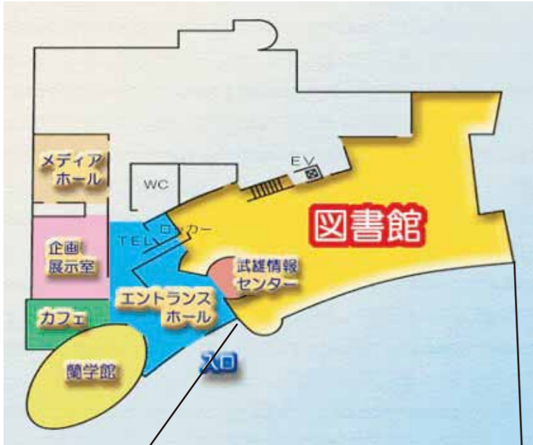
図書館部分配置図